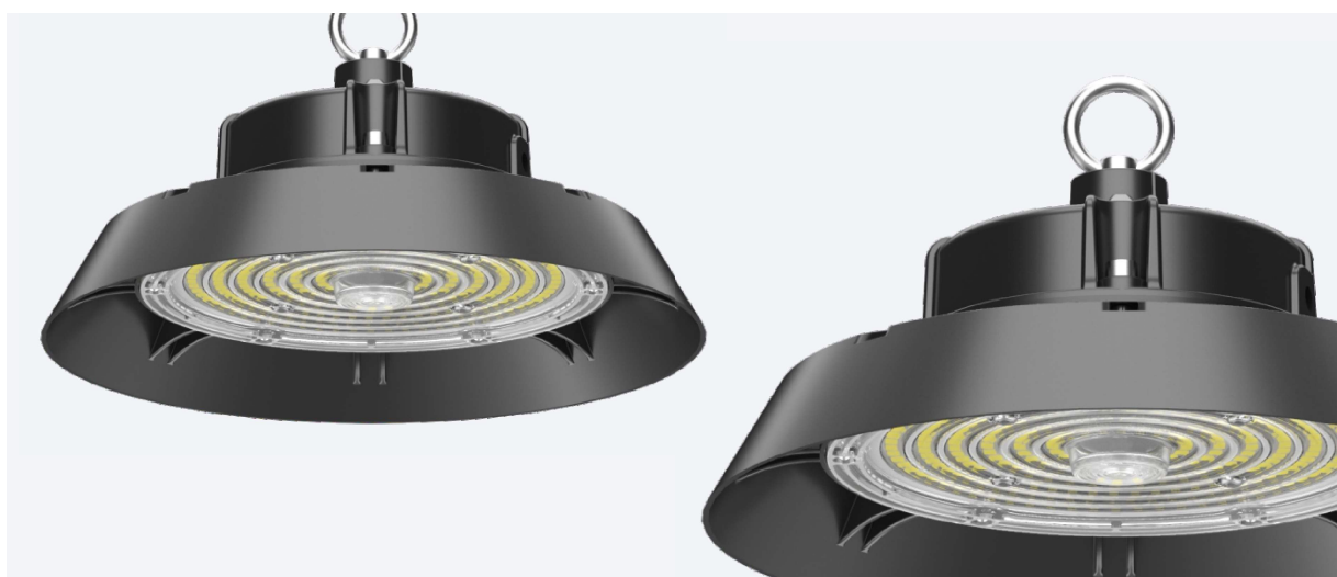
Тип КСС Д, 120°